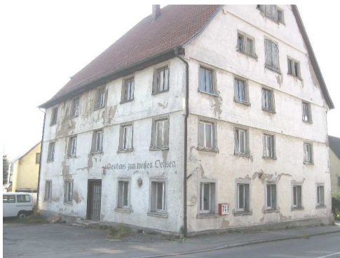
Bild 1: Der „Weiße Ochsen“ in Pfullendorf. Vor dem >Abbruch<. Ein altes Gebäude, das wirtschaftlich nicht mehr sanierbar war.

Abbruch und Entfernung vorhandener Bauteile. Dabei wird unter den Größen der Bauteile nicht unterschieden. Das Fenster ist ebenfalls ein Ausbau oder Abbruch. Gleichzustellen mit dem Abbruch eines gesamten Gebäudes.