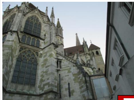
Bild rechts: Die Westseite des Regensburger Doms mit den Verglasungen.

Mehr über den zeitgemäßen Fenstereinbau: