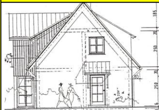
Bild rechts: Wenn bei einem Eingabeplan beispielsweise die Dachneigung während der Bauphase verändert werden muss, ist dies über eine Tektur beim Bauamt nachzureichen.

Bauen bedeutet ein stetiges lernen aus den Bauphasen. Oftmals ist es erforderlich wenn eine fertige Baugenehmigung vorliegt, während der Bauzeit entsprechend wichtige Details die vom geplanten Bauplan aus der Praxis verändert wurden mit einer Tektur beim Bauamt nach zu genehmigen. Gleiches gilt auch, wenn eine Baugenehmigung bereits beantragt und eingereicht wurde und im Laufe des Verfahrens noch Änderungen nachgetragen werden müssen. Um allerdings solche Änderungen vorgenommen werden können, müssen dann auch alle Dokumente wie beispielsweise Baubeschreibung, Flächenberechnung und Baukostenberechnung berichtigt werden.