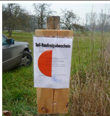
Bild links: Hier sehen wir eine Teil-Baufreigabe, da vom Baurechtsamt her, noch nicht alle Baurechtlichen Dinge geklärt sind. Entscheidend bei einer Tektur ist immer, dass diese auch unter den Vertragspartnern in den Verträgen angepasst wird.

In der Pharmazie , werden solche Veränderungen mit einem gefalteten Papier vorgenommen, das am Korken der Flasche befestigt wird, deren Rezeptur verändert wurde.