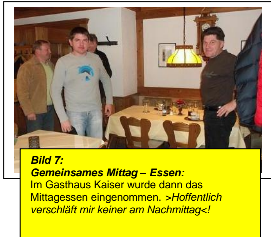
Bild 7: Gemeinsames Mittag – Essen: Im Gasthaus Kaiser wurde dann das Mittagessen eingenommen. >Hoffentlich verschläft mir keiner am Nachmittag<!