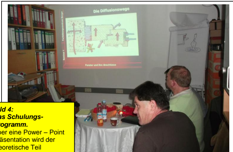
Bild 4: Das Schulungs- Programm. Über eine Power – Point Präsentation wird der theoretische Teil geschult.