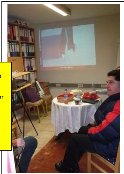
Bild 5: Der theoretische Schulungsteil: Heftige Diskussionen unter den Teilnehmern. Dem Ein oder anderen hängt auch schon die Zunge raus.