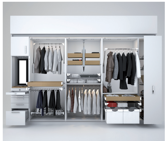
Einer von zehn Beispielschränken