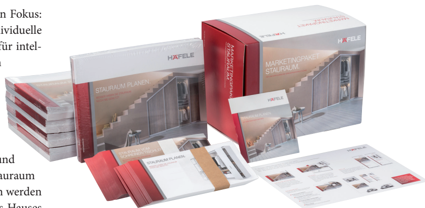
Umfangreiche Materialien im Häfele-Marketingpaket

Dadurch inspiriert können Nutzer über die angeschlossene Schreiner-Suche Stauraum-Experten in ihrer Nähe finden. Gefunden werden hier alle Schreinerbetriebe, die dies auf dem mit dem Newsletter vom Februar 2015 versandten Anmeldeformular entsprechend vermerkt haben. Sollten sie dies noch nachholen wollen, ist dies jederzeit möglich. Verwenden Sie hierzu bitte das im Mitgliederbereich, Rubrik Marketing, Rubrik Stauraum vom Schreiner eingestellte Anmeldeformular.