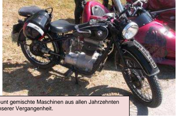
Bunt gemischte Maschinen aus allen Jahrzehnten unserer Vergangenheit.