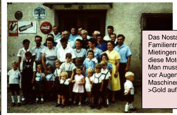
Das Nostalgiebild zeigt beim Familientreffen um 1962 in Mietingen Menschen die diese Motorräder fuhren. Man muss sich einfach mal vor Augen halten, dass diese Maschinen damals nicht mit >Gold aufzuwiegen< waren.