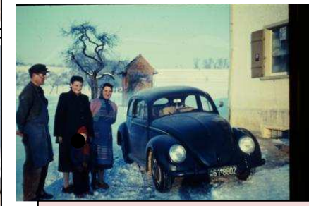
Hier einmal ein original Archibild aus dieser Zeit um ca. 1952. Menschen mussten eine schnelle Entwicklung der Technik kennen lernen.