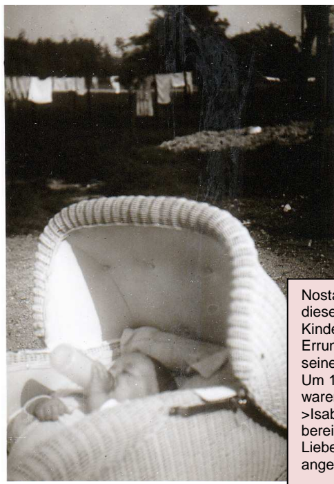
Nostalgie aus 1958, der Zeit dieser Autos. Der Autor im Kinderwagen, mit der Errungenschaft bereits selber seinen Schoppen zu trinken. Um 1959-60. Zu dieser Zeit, waren diese Autos, die >Isabella von Borgward< bereits Kult. Liebe zum Detail war angesagt.

Der Tag galt Motorrädern als Oldtimer. Die ältesten Maschinen erkannte der Autor von 1932.