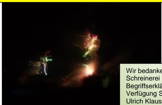
Bild rechts: Bei Silvesterknallern stellt die spezifische Energie den Druck in MPa dar. Dabei stellt ein Kilogramm eines explosiven Stoffes in einem fest, verschlossenen Volumenkörper von einem Liter die Sprengmenge in MPa dar.

Oh, „ Thierrysches Orakel “ erklär mir den Begriff: