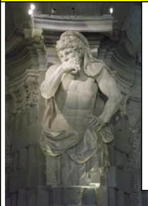
Bild rechts: Atlasfigur en von Lorenzo Mattielli im Stift Klosterneuburg bei Wien.

1748 verstarb er und wurde im alten katholischen Friedhof in Dresden begraben. 1901 wurde dann in Wien (4. Bezirk) die >Mattiellistraße< nach ihm benannt.