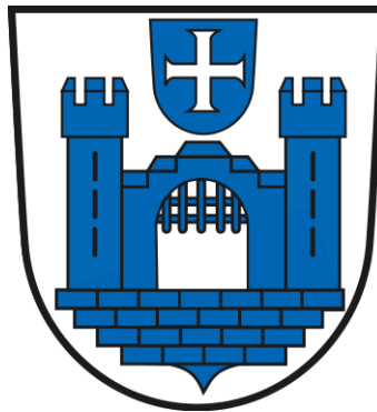
Bild links zeigt das Stadtwappen der Stadt Ravensburg im Schussental. Eine Ausnahme, in Ravensburg gibt es ein AG und ein LG.

In unserem Gerichts Aufbau, stellt das Landgericht die 2 Station der Gerichtsbarkeit der ordentlichen Gerichte dar. Der Einstieg bildet dabei das Amtsgericht (AG), das von den Landbezirken unterhalten wird. Dabei ist die Grenze des Streitwertes bei 5.000.-€ gegliedert. Somit das Landgericht ab 5.100.-€ für die Klageeinreichung zuständig ist und darunter das Amtsgericht. Dabei finden wir dann in den Ländern mehrere Landgerichte, die auch als Berufungsgericht des Amtsgerichts zuständig sind.