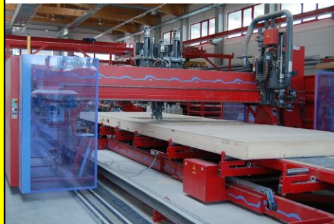
Bild aus der Fertigung Firma Weiss GmbH Fertighausbau.

Mehr über Holzständerbauweise : Eine Bauart aus dem Fertighausbau.