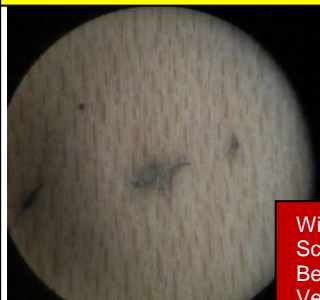
Bild links: Die mikroskopische Aufnahme zeigt in der 24 fachen Vergrößerung, Lackierschäden aus Feststoffen in der Lackfläche. Daraus resultieren dann die Lackschichtstörungen.

Begriffe Beschichtungsstoffe Best. nicht flüssiger Anteile Best. der Auslaufzeit