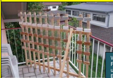
Bild rechts: Hier sehen wir jetzt den Prüfstand, in der freien Bewitterung. Hier werden jetzt die Probanden in den unterschiedlichen Proben einem Langzeitversuch im Freien ausgesetzt um sie später gegenseitig zu vergleichen.

Mehr über Allwetterfolie tremco illbruck :